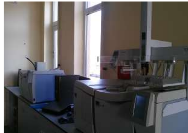
Produktu drošības, mikrostruktūras, arī bioloģiski aktīvo vielu testēšana