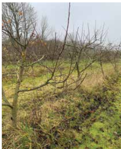
Augļu dārzs pirms ziemas perioda

dārzos. Ķirši daudz apsala, bet, kur lija lietūs, veidojās labi jaunie zaru pieaugumi pie nosacījuma, ka saldajiem ķiršiem tika apkarotas laputis. Lai arī plūmes apsala mazāk, situācija veidojās līdzīga. Labas ražas veidojās krūmceidonijām un pīlādžiem, tas nozīmē, ka krūmi un koki būs patērējuši daudz resursu, bet tā kā to lielākajai daļai ziemcietība ir augsta, nav paredzams īpašs risks, lai šīs kultūras labi neziemotu. Pīlādžiem gan, visticamāk, tik augsta raža nākamajā gadā nebūs gaidāma. Ar augstu ražu izcēlās aronijas, bet tā kā tām ir augsta sala izturība, nav bažu, ka tās ziemošanas apstākļu dēļ varētu nedot ražu nākamgad. Ļoti labas ražas šogad daudzviet deva persiki un aprikozes. Par šo kultūru, jo sevišķi persiku ziemošanu, gan ir zināmas bažas. Pēc tik bagātīgas ražas kociņi ir iztērējuši daudz resursu, un ziemošanai nav uzkrāts pietiekami daudz barības vielu. Tādēļ, lai izvairītos no riska, persikiem nepieciešams bagātīgās ražas normēt. Otrs, ir jāierobežo jauno dzinumu augšana un tie jāveido ar lēzenākiem leņķiem. Tas nozīmē, ka dzinumus īsinot, atliecot un normējot augļus, tiek panākts līdzsvars starp ražas veidošanu un jauno dzinumu veidošanos. Bez šīm korekcijām risks, ka persiku koki var apsalt, ir diezgan augsts.