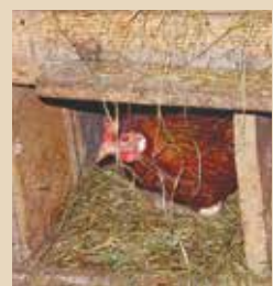
■ Bioloģiskās saimniecības Polijā. .... 15