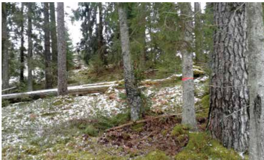
Boreālais mežs pēc Eiropas biotopu klasifikatora