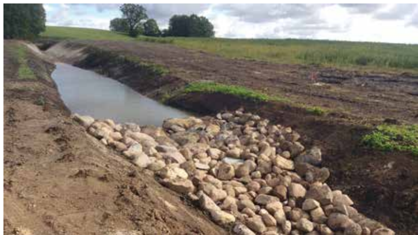
Vides pasākums – uztvērējbaceins ar akmeņu bērumu novadgrāvī

Pamatā bija jānodrošina promteku – strautu un upju – pietiekošs caurplūdums pavasaru palu laikā. Bieži tika pielietota promteku taisnošana. Projektējot meliorācijas sistēmas, t. i., sistēmas zemju nosusināšanai un zemju apūdeņošanai, minētajos gados