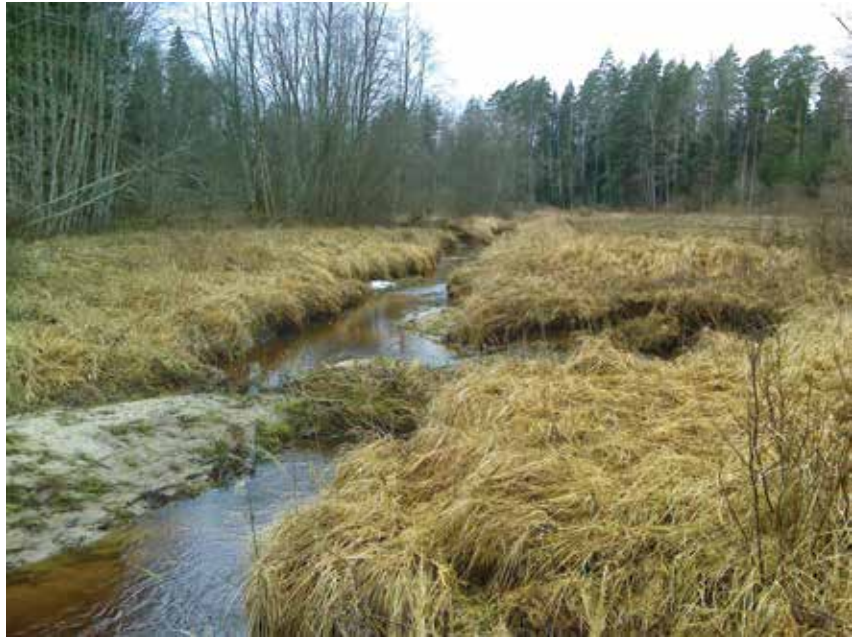
Ūdens notekas meandrēšana