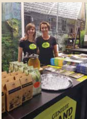
Asociācija “Lauku ceļotājs” – kā vienmēr ar bagātīgu informācijas klāstu par Latvijas apceļošanas iespējām