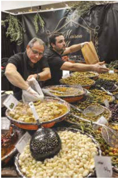
Apmeklētājus īpaši vilināja plašais olīvu piedāvājums vienā no Francijas stendiem