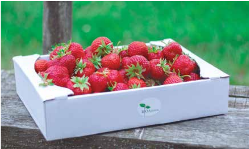
Zemeņu fasašanai izmanto otrreiz pārstrādāta kartona kastes