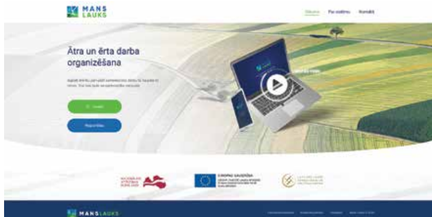
Saimniecību pārvaldības sistēmas Manslauks.lv sākuma skats