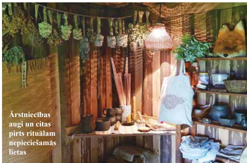
Ārstniecības augi un citas pirts rituālam nepieciešamās lietas

Latvijas Lauku konsultāciju un izglītības centrs, Rīgas iela 34, Ozolnieki, Ozolnieku pag., Ozolnieku nov., LV-3018, tālr. 63050220, admin@llkc.lv, laukutikls@llkc.lv