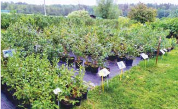
Saimniecībā tiek piedāvāti krūmmelleņu stādi