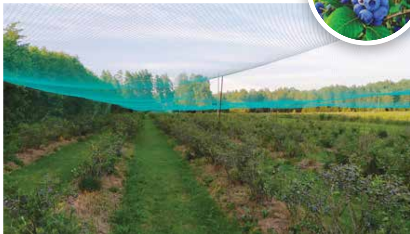
Ogu stādījumus no putniem sargā tīkls