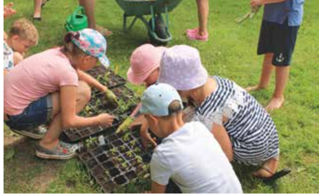
Nometnēs bērni var iegūt pirmās iemaņas dārzkopībā