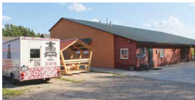
Saimniecības ražotne un pārvietojamais tirdzniecības stends