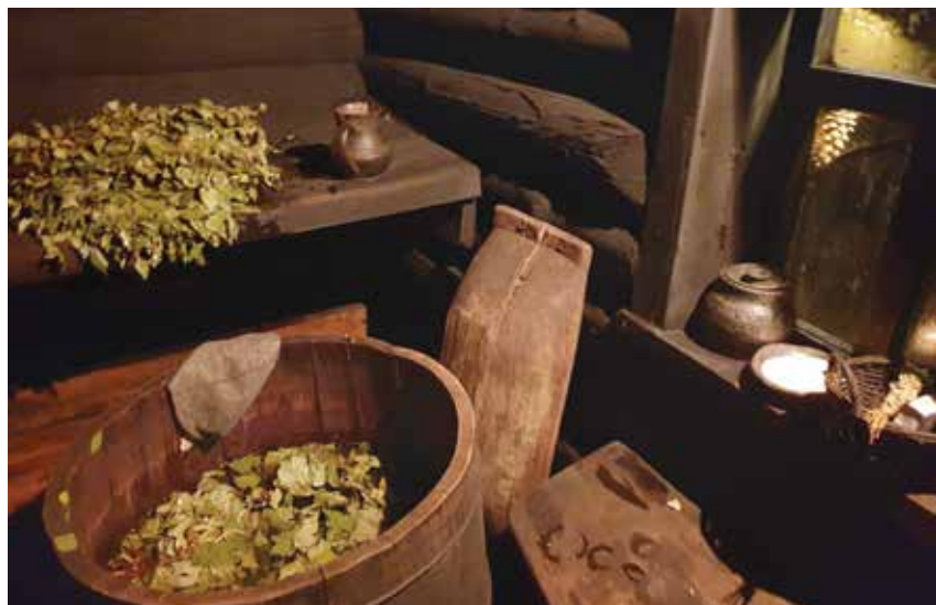
Pirts gaida gan tuvus, gan tālus ciemiņus