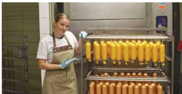
Ieva ar “Lat Angus” gatavo produkciju

Latvijas Lauku konsultāciju un izglītības centrs, Rīgas iela 34, Ozolnieki, Ozolnieku pag., LV-3018, tālr. 63050220, admin@llkc.lv, laukutikls@llkc.lv