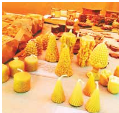
Guntas gatavotās dabīgā bišu vaska sveces

Arī koks un tā apstrāde “Līdumu” mājās cieņā bijuši sen. Ar mīlestību tiek gatavoti dažādi dekorī, suvenīri un koka trauki. No koka var pagatavot daudzas lietas, tādējādi piešķirot izgatavotajai lietai “citu vērtību” – pašu veidots. Koka izstrādājumiem piemīt labvēlīga aura, tāpēc cilvēks labi jūtas telpā, kurā tie atrodas. Darbā tiek izmantotas arī senās latvju zīmes. Varam vien iztēloties, kāds varens visaptverošs spēks un noslēpumainība piemīt katrai no tām. Katram gadījumam jālieto sava zīme, tādēļ ir svarīgi ticēt un koncentrēt savu enerģiju uz vēlamo. Koka traukus var izmantot sadzīvē, gan arī kā dekoratīvus elementus. Īpašas rū-