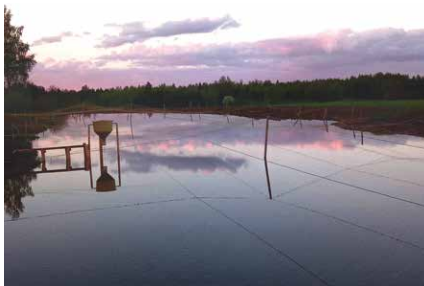
Dīkis tika pārveidots par zivju audzēšanai piemērotu