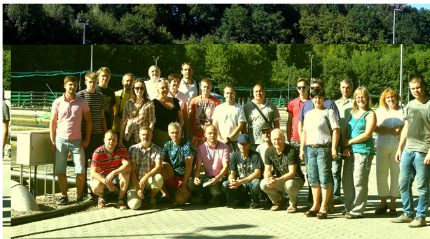
Pieredzes apmaiņas brauciena dalībnieki

Nākamajās dienās noklausījāmies kompānijas „Aqua Syster” speciālistu lekciju un praktisko prezentāciju par akvakultūras ūdens recirkulācijas sistēmu projektēšanu, būvniecību, ūdens recirkulācijas sistēmu iekārtu un aprikojuma ražošanu forelēm. Apmeklējām „Budowko” foreļu fermu, kurā veiksmīgi tiek realizēti ES zivsaimniecības atbalsta projekti, un foreles tiek audzētas kā vaislas materiāls, kā arī inkubēti foreļu mazuļi atklāta un slēgta tipa recirkulācijas sistēmās. Apskatījām liela apjoma prečzivju audzētavu „K2”, kur gadā tiek izaudzēts ap 700 tonnām foreļu.