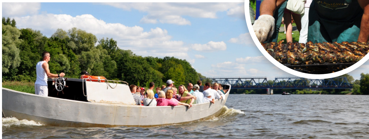
SIA „Leste” zvejas laiva vizina svētku dalībniekus