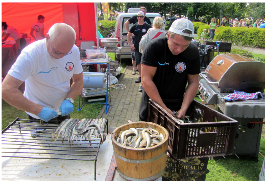
Firma "Gaujas nēģi" gatavoja cepšanai