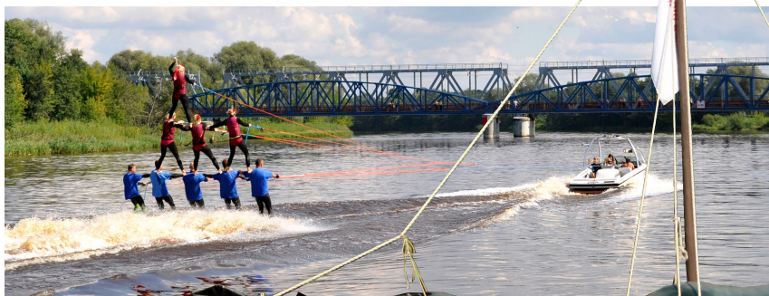
Kluba "Partizāņu ugunskurs" demonstrētais ūdens akrobātu šovs