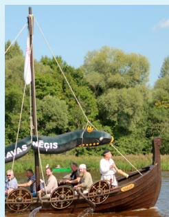
■ Carnikavas novada XV Nēgu svētki nosvinēti! ..... 7