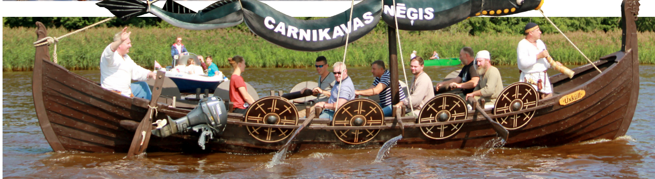
Nēgu karaļa ierašanās ar zvejnieku airēto vikingu laivu