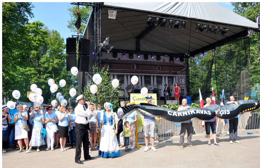
Svētku atklāšana ar priekšsēdētājas svinīgo runu

Bez vietējiem cepējiem Muižas ostā savu māku gatavot nēģus demonstrēja Igaunijas prezidenta šefpa-