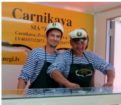
SIA "Zibs" nēgu cepēji aicina nobaudīt delikateses