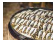
Zvejnieku svētkos Jūrmalcieņā pieejams arī garš cienasts