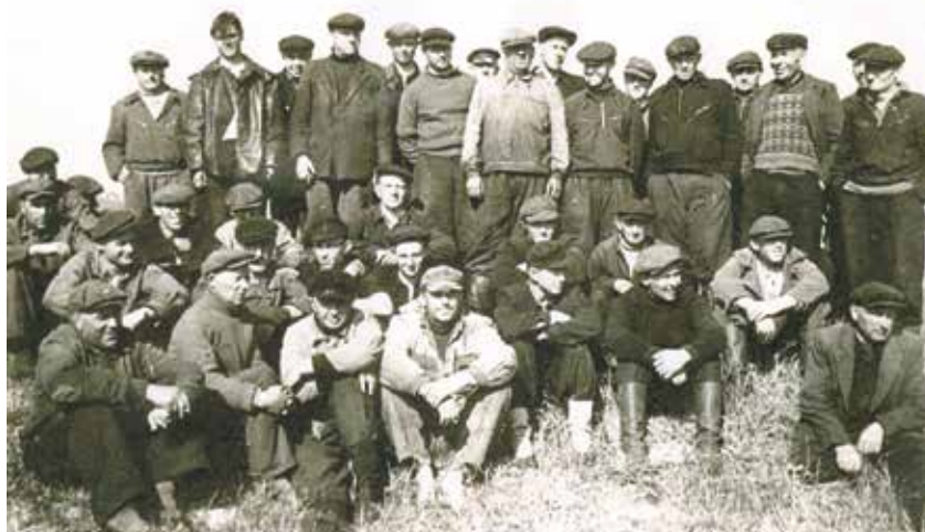
“Sarkanās blāzmas” zvejnieki