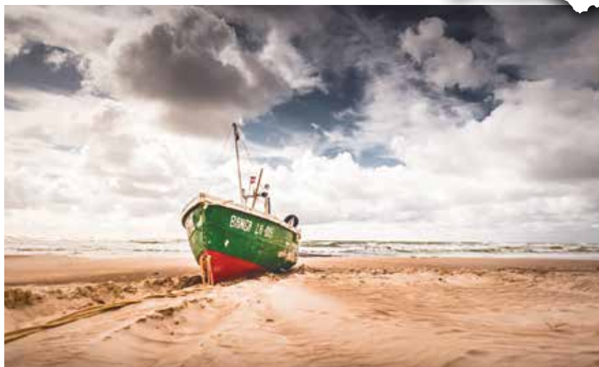
Jūrmalcietu neatņemamas lietas: jūra, smiltis un zvejnieku laiva