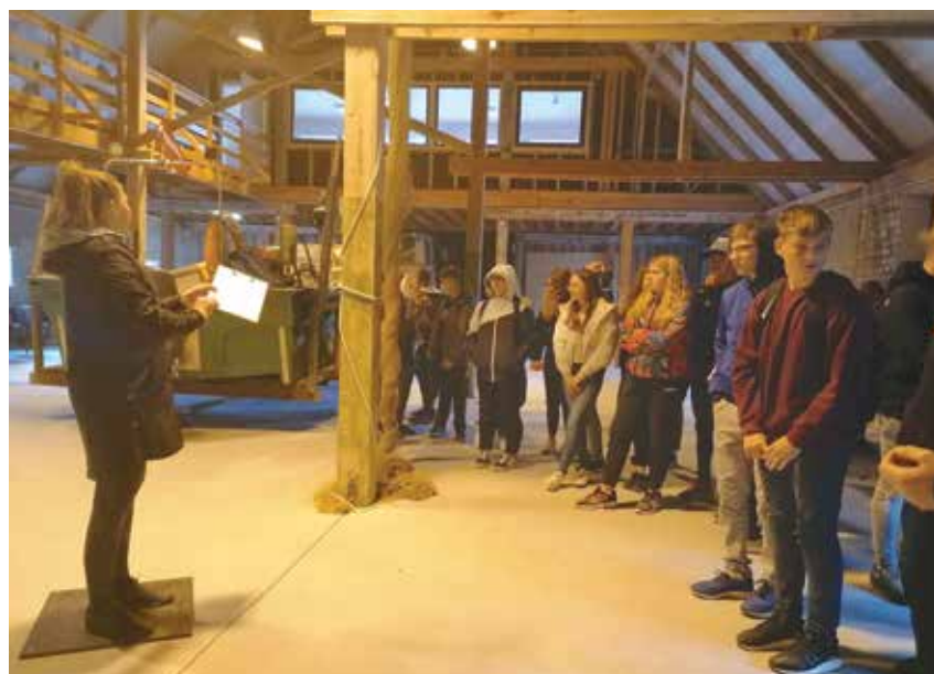
Izglītojošais pasākums Tīklu mājā skolēniem kopā ar ZIIC Dabas māja