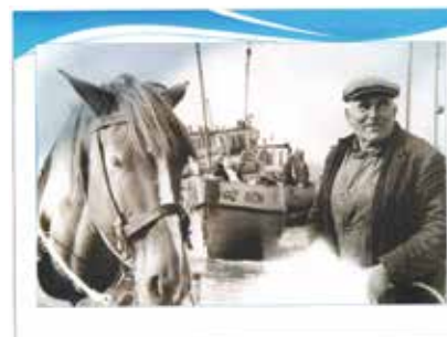
Zirgi agrāk bija neaizstājami zvejnieku palīgi

ir vieta, kur, iepriekš piesakoties, sirsnīgi gaidīts ikviens. Te pastāstīs par Jūrmalciema zvejnieku skaudro un neparasto darbu, par zivju pagatavošanas tradīcijām, tā ir vieta, kur iespējams iepazīties ar piekrastes zvejniecības pirmsākumiem, tradīcijām un attīstību.