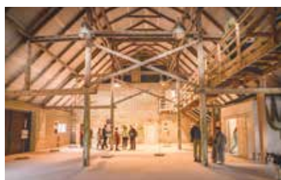
Tīklu māja uzņem viesus Zvejnieku svētku laikā