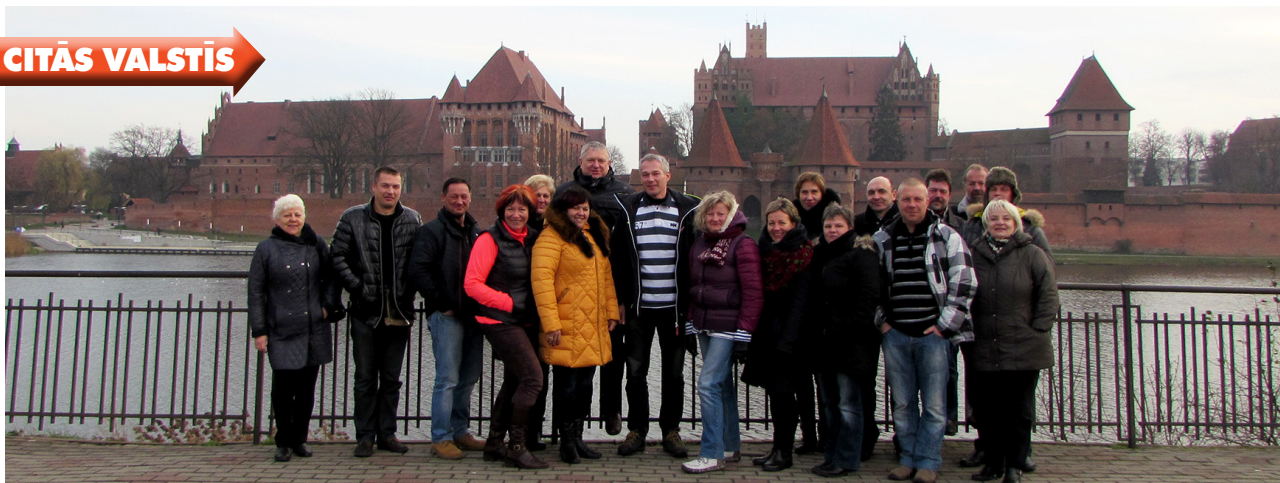
Pieredzes brauciena dalībnieki