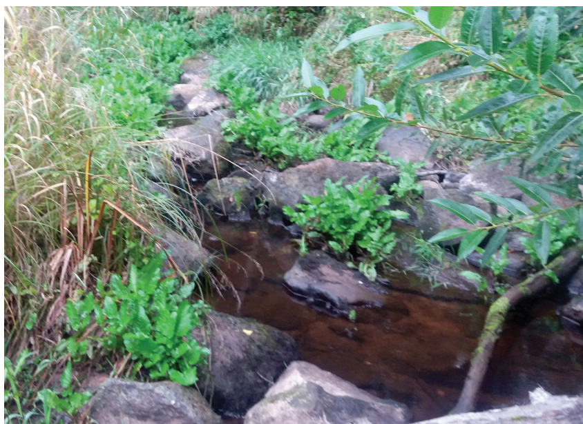
Ziemā un rudenī šiem akmeņiem pāri plūst ūdens. Šeit lasis vai taimiņš varētu nārstot, ja nebūtu apauguma

BIOR Zivju resursu pētniecības departaments, Akvakultūras un ihtiopatoloģijas nodaļa