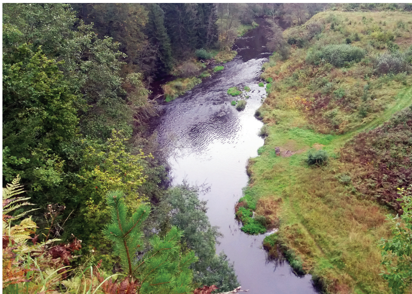
Upes brasls mazūdēns laikā. Ja tiktu likvidēts apaugums, tiktu aizskaloši sanesumi, atsegtos akmeņi un oļi, un paplašinātos nārsta platība ziemā, kad ūdens līmenis ir augsts

Piekraustes upes un upītes ir “bērnistabas” mūsu nacionālajam lepnumam – lasim. Tās ir mājas forelei, taimiņam un vimbai. Mazās upītes ir pirmā mājvieta šo zivju kāpuriem un mazuļiem. Lai zivs izaugtu no kāpura līdz pieaugušam īpatnim, tai ir nepieciešama specifiska un pēc iespējas dažādāka