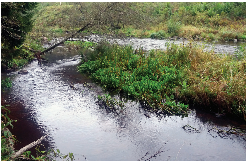
Potenciāli tīrāmā vieta tuvplānā

vide, jo savā attīstības gaitā tās barojas, sākot ar vismazākajiem vēžveidīgajiem, līdz lieliem kukaiņu kāpuriem un citu zivju mazuļiem. Dažādi organismi dzīvo dažādos biotopos. Īpaši liela barības dažādība ir nepieciešama lielajiem plēsējiem, lašiem, taimiņiem, forelēm. Un šī plēsīgo zivju barība attīstās dažādā vidē, arī uz kritālām un ūdenī iegremdētām siekstām.