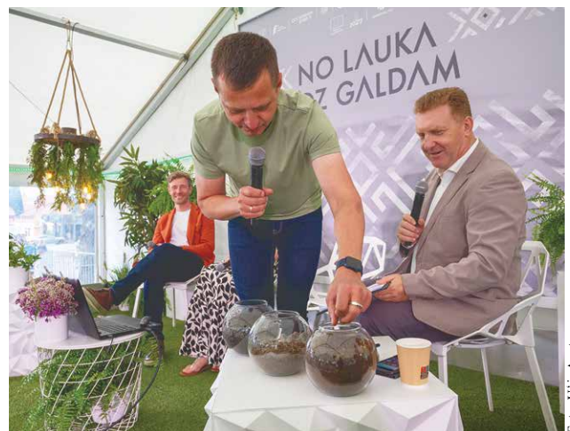
Diskusijā “Pārtikas pašpietiekamība – vai un cik tas mums ir svarīgi?” arī zemkopības ministrs Armands Krauze centās sataustīt, kura zeme ir “tukša”, bet kura – auglīga