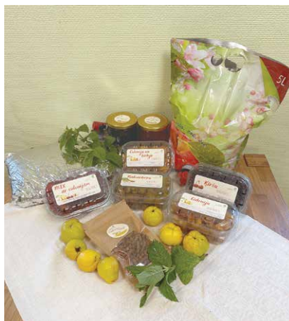
Māra Šaršūna mājražošanas produkcija