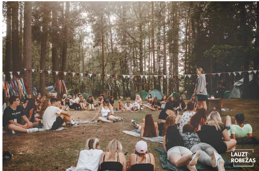
Foruma laikā notika ne tikai diskusijas, bet arī dažādas komunikāciju veicinošas spēles jauniešiem

Foruma ietvaros organizētajās darba grupās dalībniekiem radās idejas, kā veicināt jauniešu aktīvāku iesaisti, piemēram, jauniešu pilsoniskās aktivitātes