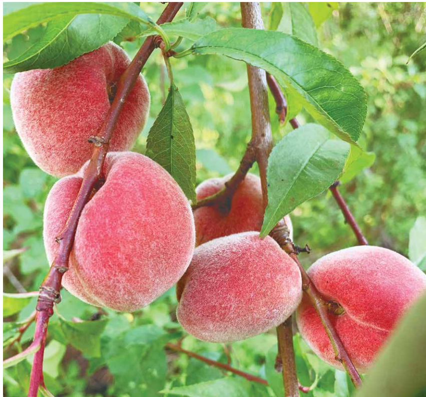
Persiku šķirne ‘Maira’

Persiku stādu cenas svārstās no 15 līdz 20 eiro par kailsakņu stādiem, līdz 20–35 eiro par konteina stādu. Tā kā persikiem miera periods beidzas agri, pat pirms Kaukāza un hibrīdplūmēm,