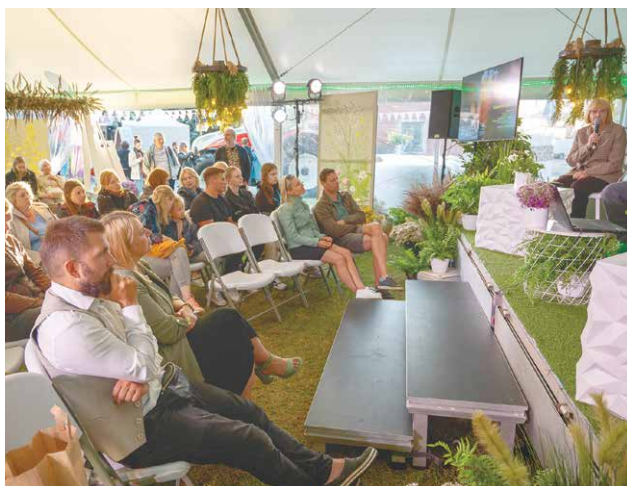
Dalība LAMPĀ bija lieliska iespēja par sarežģīto lauksaimniecības, pārtikas un vides jomu runāt sabiedrībai saprotamā valodā, mudinot aizdomāties par ikdienas izvēlēm