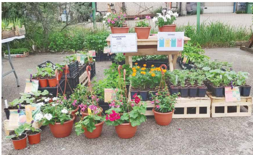
Annas aizrašanās ir arī dažādu stādu audzēšana